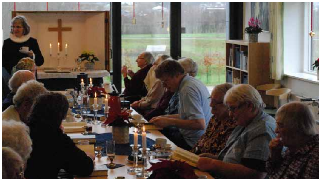
Tolv beboere, tre medarbejdere, et familiemedlem og fire frivillige medhjælpere er samlet om bordet til gudstjeneste i fællesrummet.

"Jeg bliver helt rørt, når jeg kommer her ud på Bronzealdervej, og ser, at bordet er dækket fint op, at alteret er sat op og klaveret er sat frem. Så bliver jeg virkelig rørt og også lidt ydmyg," siger hun.