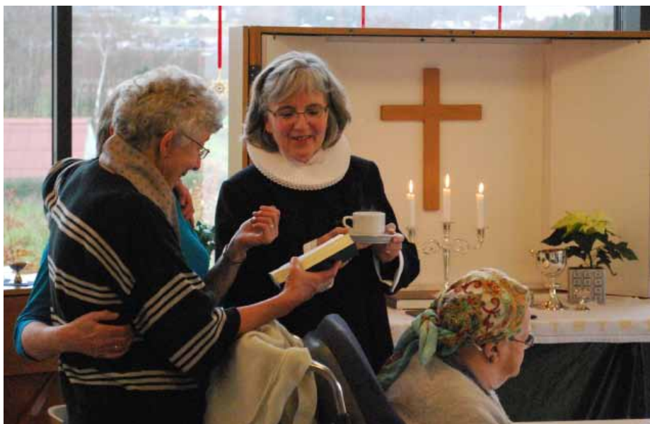
Efter gudstjenesterne er der altid tid til en kop kaffe og en snak.

En halv time før gudstjenesten kommer den første beboer. Hun har taget