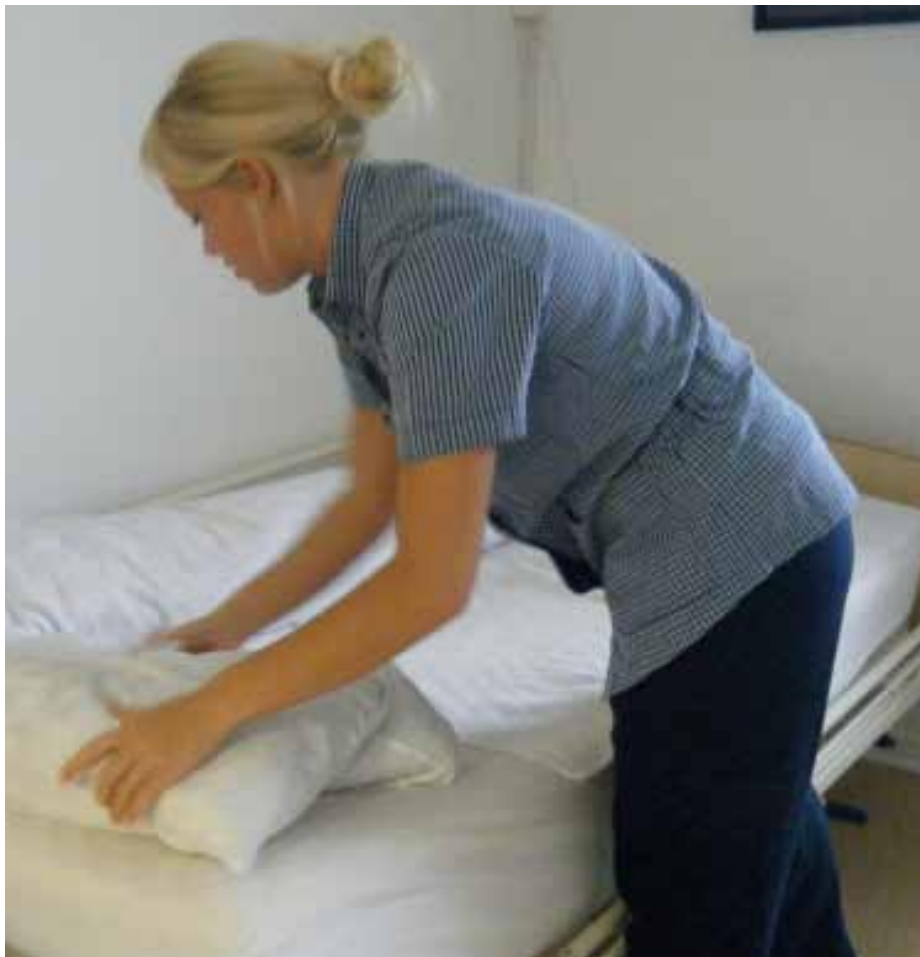
Arbejdet på Bronzealdervej er delt i tre. Første del er den basale personlige pleje, som bare skal være i orden. Anden del handler om livsglæde, og tredje del er det administrative arbejde.

ord på personalets arbejde, og det bevidstgør alle der er i berøring med plejehjemmet om, hvilke målsætninger plejehjemmet har i forhold til beboerne. Det har altid ligget på de tre kvinders rygrad at forbedre beboernes livssituation i det daglige arbejde.