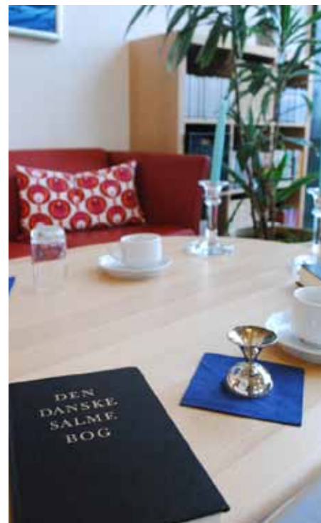
Gudstjenesterne på landets plejehjem er et gratis tilbud fra folkekirken. Plejehjemmene står selv for opdækning og planlægning.

der bliver gjort noget ud af gudstjenesterne. Mange af de ældre ser frem til dem, og det skaber en fælles platform for samtale på plejehjemmet resten af dagen.