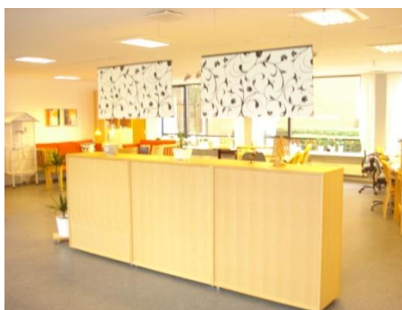
Billederne er fra Kristianslyst