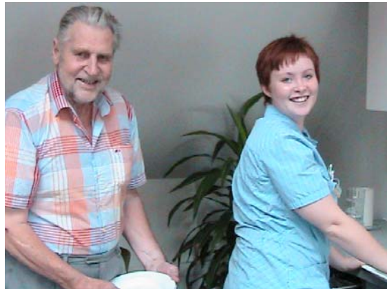
Samspil og relationer skabes i nærværet.

Hvordan har "Pædagogiske metoder i Ældreplejen" ændret din hverdag?