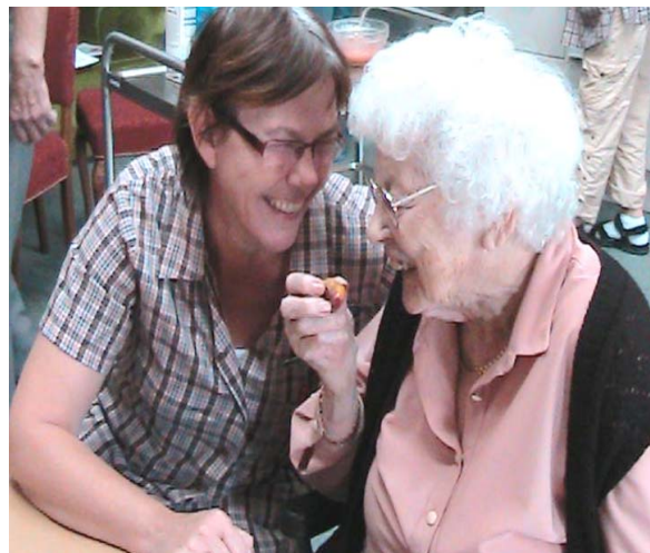
- En hverdag med flere smil

ikke andet, når først vi er "ploppet i". Men vi dykker kort, for at komme til overfladen igen!